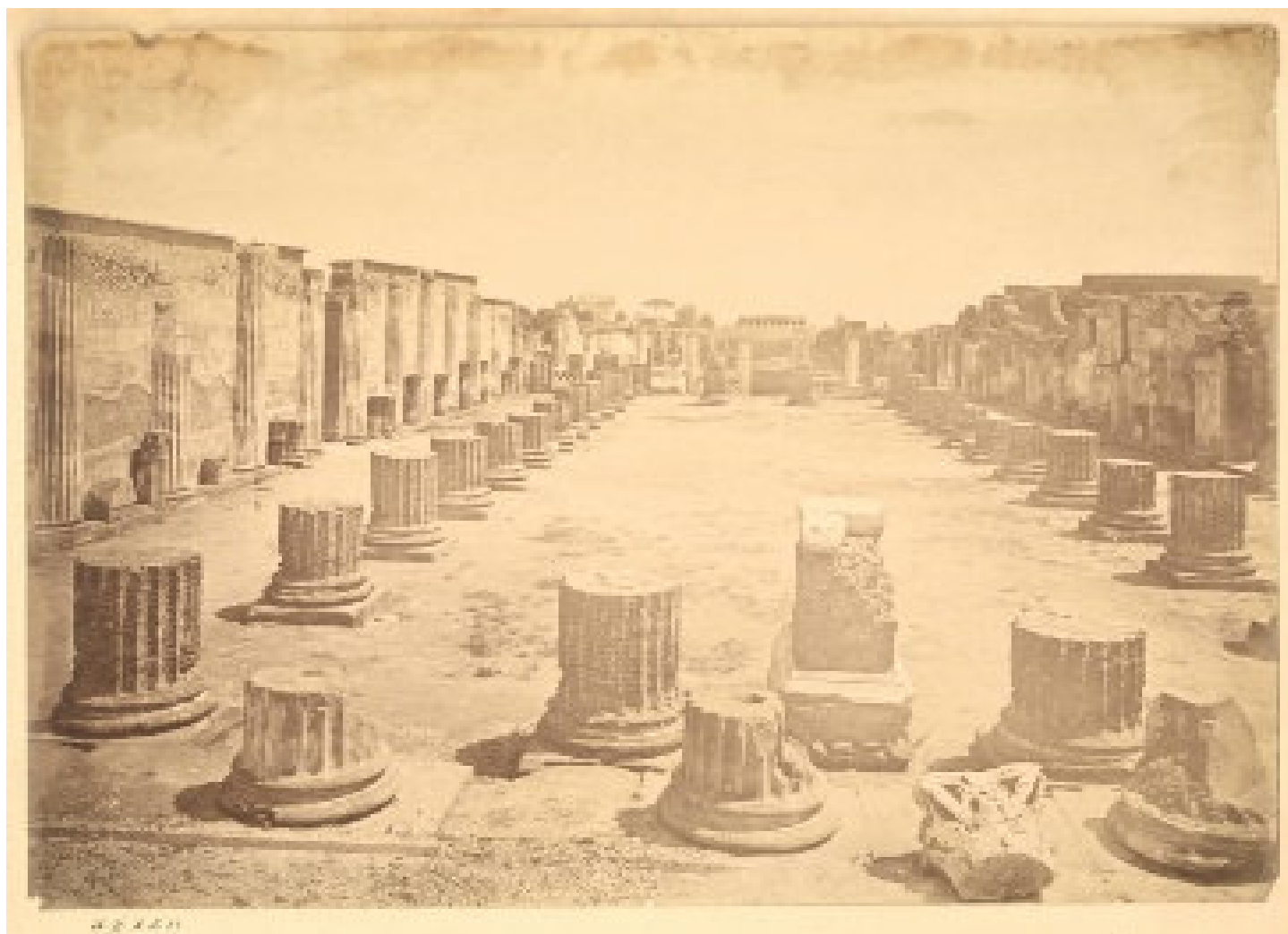
图 1-1-1 罗马的废墟